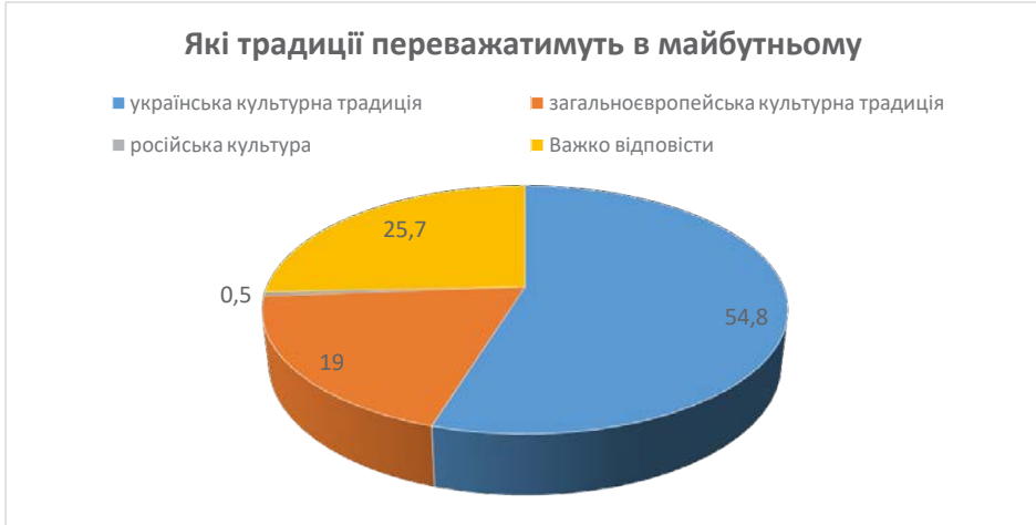
Рис. 2. Яка культурна традиція буде в майбутньому переважати (через 25 років)

яння різних ціннісних орієнтацій, ідеологій та соціальних практик, це є актуальним для України сьогодні, а особливо для її багатого історією й полікультурного населення (Ткачук, 2022).